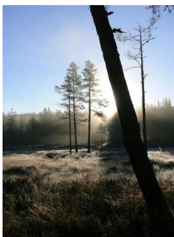
Utsikt fra elgpost.

Vedtatt i kontrollutvalget 22.11.21 Behandlet i kommunestyret XX.XX.XX , sak 0XX/2X